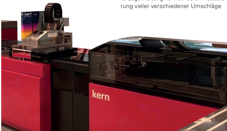
DJM C500, integriert in Kern 3600 mit Print@Exit.