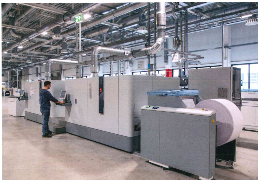
Ausbildung zum/zur Maschinen- und Anlageführer(in): Lernen und Arbeiten in einem der größten und modernsten Druckzentren Europas

agree21 Mailing angeboten. „Uns blieben genau 21 Tage Zeit, die Druckaufträge unserer Kunden zu verarbeiten. Das waren sehr heiße 21 Tage“, beteuert Ritter und fügt erklärend hinzu: „Das monatliche Output-Volumen an Großbriefen (C4-Format) in den Druckzentren der Fiducia & GAD liegt im Durchschnitt bei ca. 450.000 Sendungen. Innerhalb dieser 21 Tage kam durch die Sonderaktion die dreifache Menge hinzu.“ In dieser Situation habe sich das „Mehrstandort-Konzept“ mit den Druckstandorten Berlin, Karlsruhe und Münster erneut bewährt, so Ritter: „In Karlsruhe zentral aufbereitet, konnte das gesamte Druckvolumen auf alle Standorte verteilt werden. Nur so war es möglich, diese großen Mengen innerhalb des knappen Zeitrahmens zu verarbeiten.“