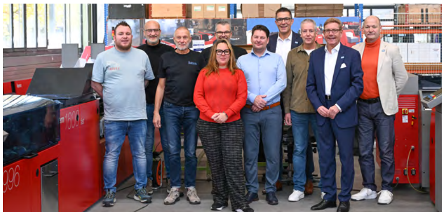
Projektteam DUO zu Besuch zur Maschinenabnahme bei der Kern AG in Konolfingen (Schweiz)

Bei der Dienst Uitvoering Onderwijs, kurz: DUO, wurden zwei neue Kern Hochleistungs-Kuvertiermaschinen installiert: eine Kern 1600 und eine Kern 3600. Die Entscheidung für die Investition in Anlagen von Kern ist das Ergebnis einer europaweiten Ausschreibung.